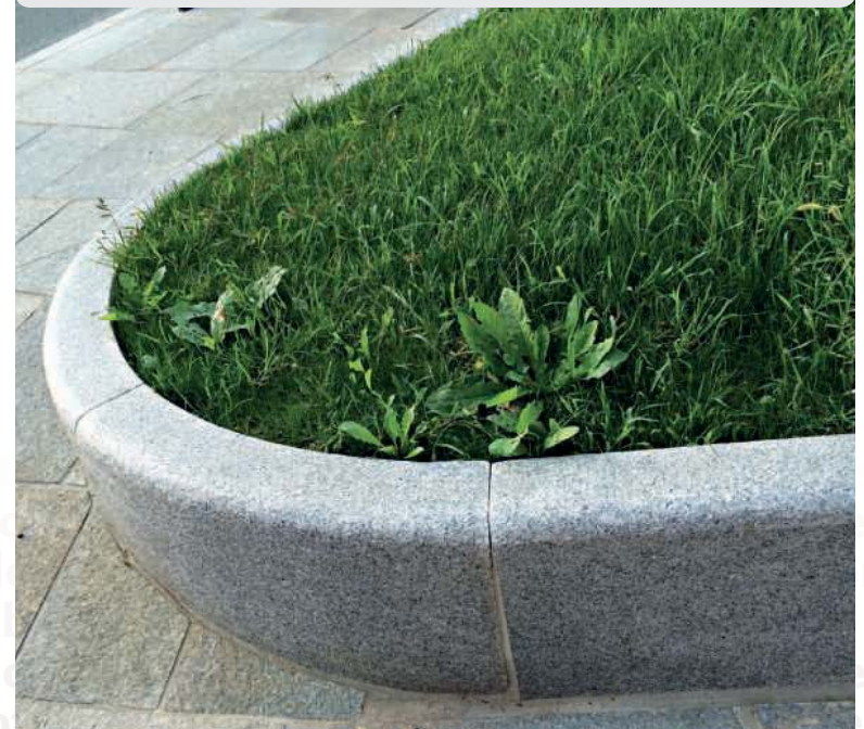
Curva assemblata per marciapiedi

Con curvature e raggi diversi sono eseguite a progetto.