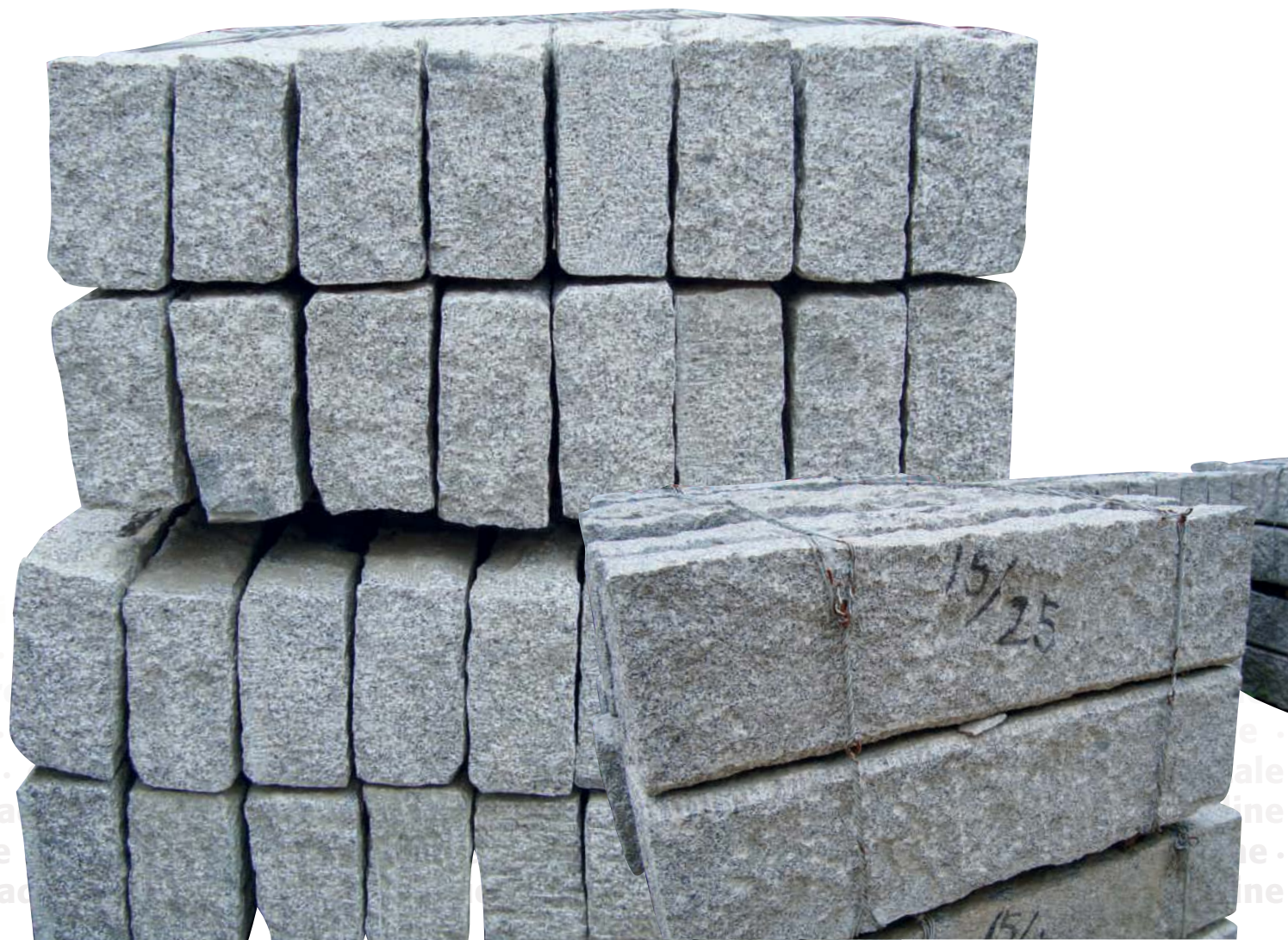
CORDOLO STRADALE LAVORATO ALLA PUNTA MEZZANA

... pav lependi e .. pen e .. scale lependiline · pavimentazioni · lastre · nepavim... cordoli strada e .. pensiline · pavimentazioni · lastre nepavimentazioni · lastre · cordoli strada