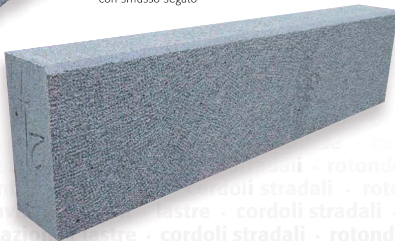
SEGATI E BOCCIARDATI con smusso segato