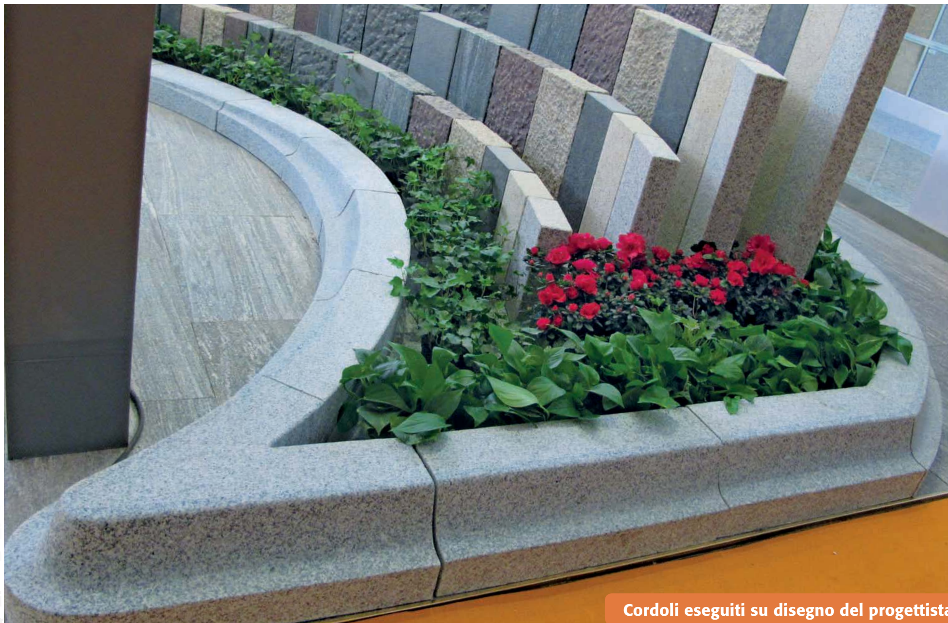
Cordoli eseguiti su disegno del progettista