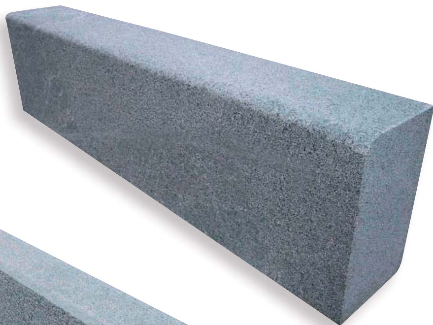
SMUSSO SEGATO 1X1