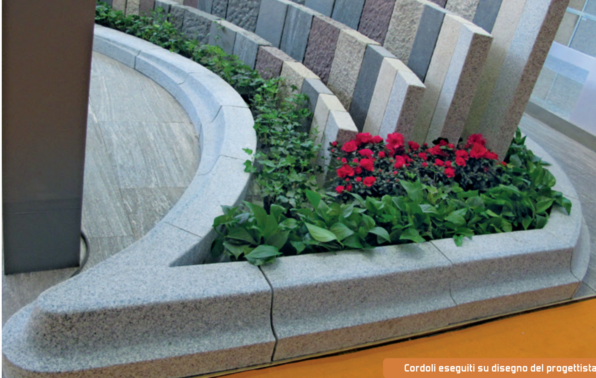
Cordoli eseguiti su disegno del progettista