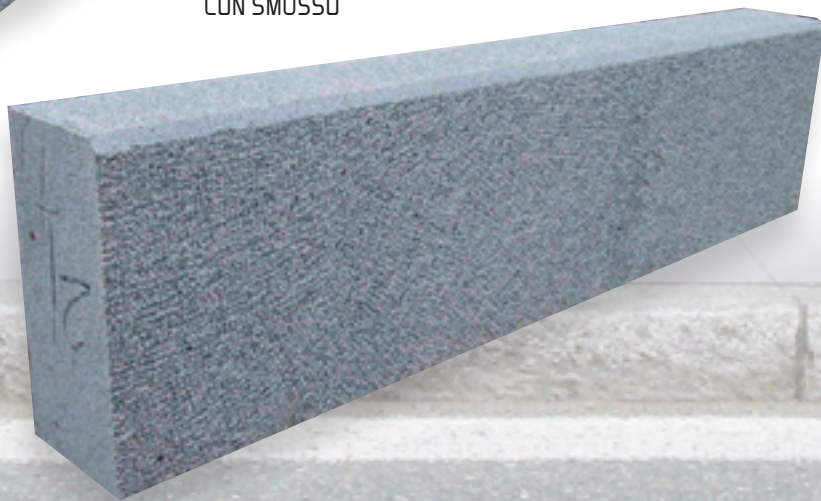
SEGATI E BOCCIARDATI CON SMUSSO