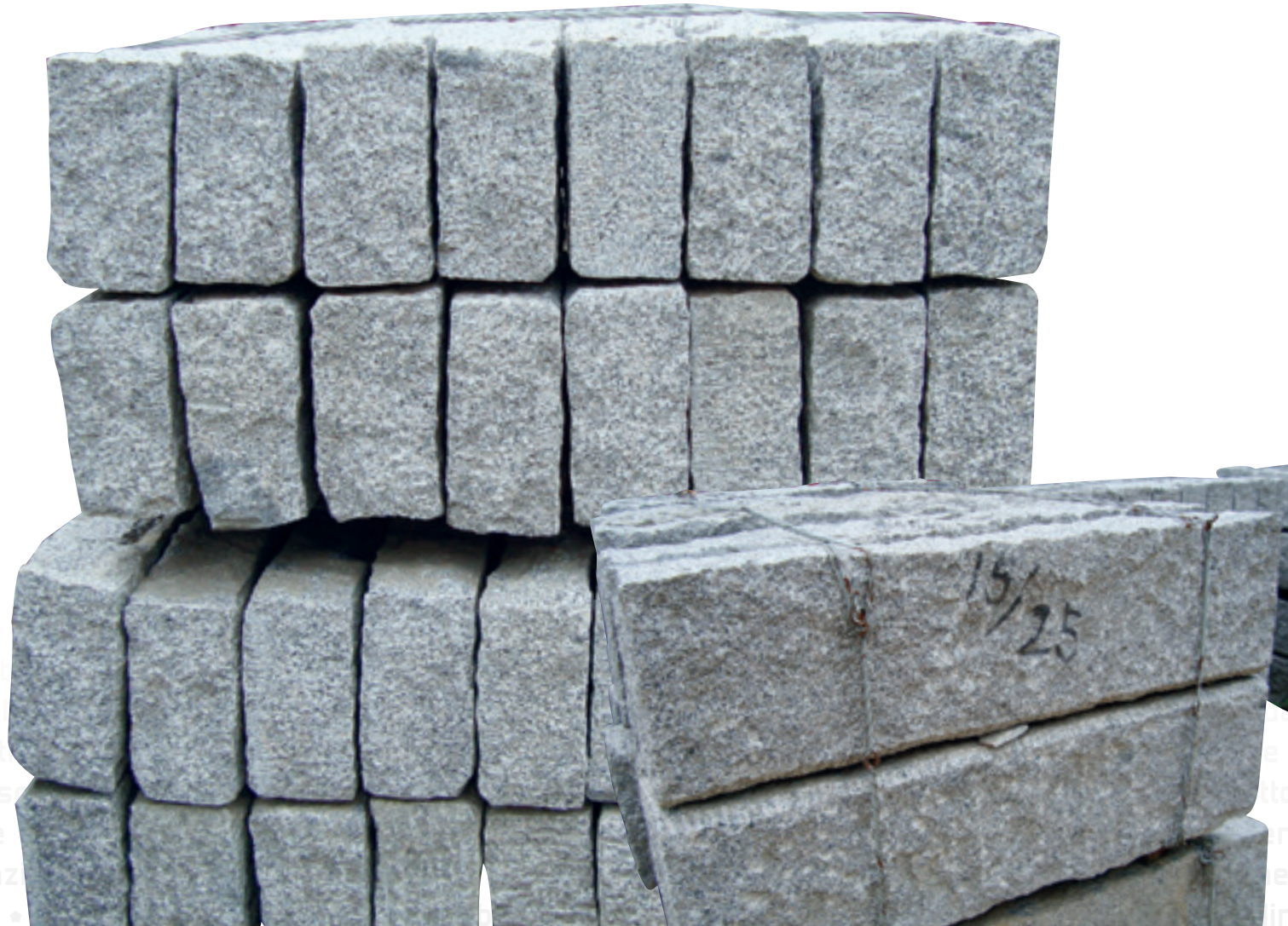
CORDOLO STRADALE LAVORATO ALLA PUNTA MEZZANA

pavime • lastr cordoli • roton cubetti • ciottoli • rivestimenti • fontane • s • rivestimenti • fontane • scale • pensiline • fontane • scale • pensiline • pavimentaz scale • pensiline • pavimentazioni • lastre •