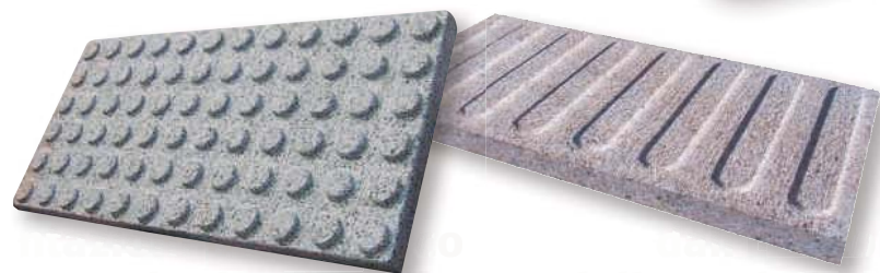
LASTRE GODRONATE INDICATE NELLA REALIZZAZIONE DI PERCORSI PER IPOVEDENTI