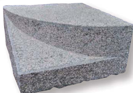
VOLTATESTA CON ALETTA