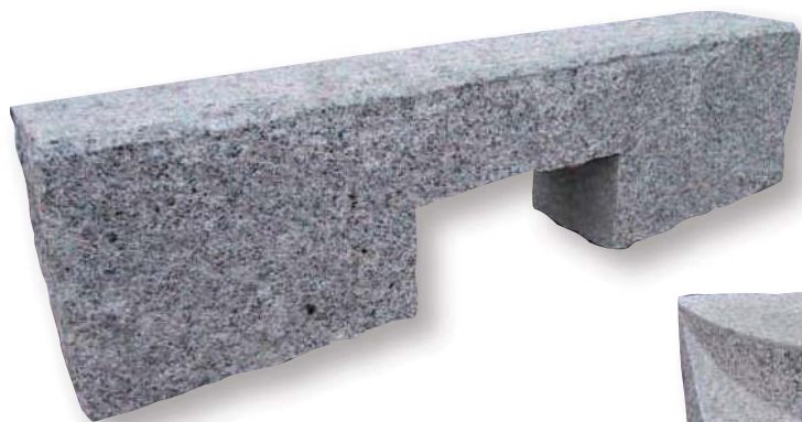
CORDOLO BOCCA DI LUPO