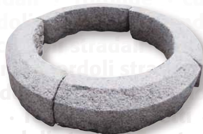
CORNICI PER ALBERI CM 100X100 (4 PEZZI)